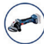
GWX 18V-8 WINKELSCHLEIFER