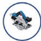
GKS 18V-57 KREISSÄGE