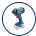
GDR 18V-160 AKKU-SCHLAGSCHRAUBER