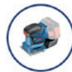
GSS 18V-10 SCHWINGSCHLEIFER