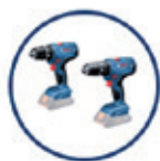
GSR/GSB 18V-21 AKKUBOHRSCHRAUBER

*Starter-Sets und Profi-Sets mit 2 oder mehr Geräten sind von der Aktion ausgenommen. Alle Geräte ohne Akku und als Karton-Version.